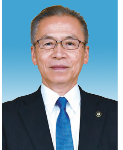
船橋市長 松戸 徹

昨年来、新型コロナウイルス感染症は、多方面にわたって甚大な影響を及ぼしており、現在の感染状況を見ても未だ予断を許さない状況です。