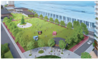
南船橋駅前の芝生広場 ※イメージであり、関係機関との協議等により変更となる可能性があります。

また、大規模集客施設等が集積し、市内外から多くの人々が集まる臨海部では、JR南船橋駅前にある約4・5haの市有地を活用し、臨海部の玄関口にふさわしい魅力あるまちづくりを進めています。本事業では、土地のポテンシャルを最大化すると共に、公的負担を最小化するため、民間活力を活用しています。民間事業者は商業施設や集合住宅の整備に併せ、多目的に利用できる大規模な芝生広場やインフォメーションセンターを整備します。このまちづくりにより、賑わいの創出と回遊性向上を促し、臨海部の魅力をさらに向上させていきます。