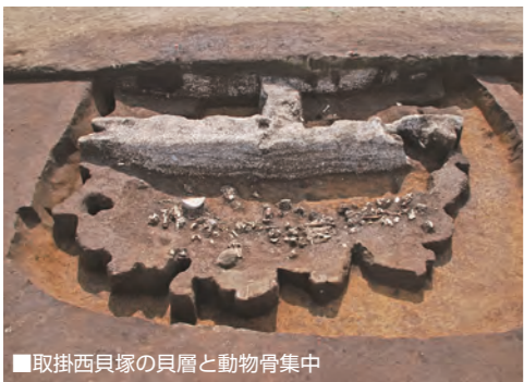
取掛西貝塚の貝層と動物骨集中

遺跡は、本市の歴史や文化の成り立ちを知ることができるだけでなく、地域の将来の文化環境を形作る重要な資産であることから、多くの方に取掛西貝塚を知っていただくよう今後取り組みたいです。